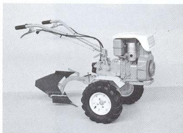
Equipada con arado reversible y ruedas de 400 x 8