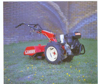
Foto superior izquierda: LANDER 120 con ruedas 6-12 y fresa rotativa.

Al disponer de un manillar reversible, puede también trabajar con accesorios frontales como barra segadora, desbrozadora, cortacésped, cuchilla frontal limpiadora, quitanieves y escoba, lo que convierte al LANDER 120 en un eficaz auxiliar para trabajos de comunidades y municipios.