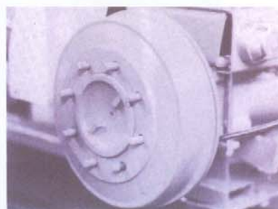
Frenos traseros superdimensionados, hidráulicos. Manual para estacionamiento