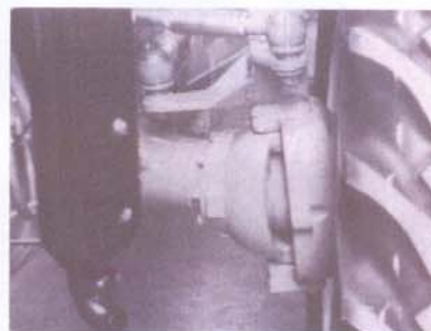
Puente anterior direccional robusto